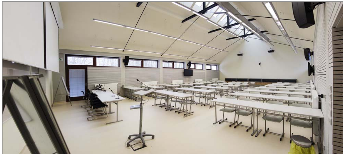
Obr. 9.3.1 Přednáškový sál MEVPIS.

Úspěšně pokračovala v roce 2013 také realizace infrastrukturního projektu v rámci OP VaVpl s názvem „Rozvoj PŘF JU“. Základním předmětem projektu je realizace investiční akce zaměřené na vytvoření infrastrukturních podmínek především pro rozvoj přírodovědných a technických oborů Přírodovědecké fakulty JU . Stěžejní součástí investiční akce byla realizace novostavby v areálu univerzity ve Čtyřech Dvorech při ulici Branišovská, která byla dokončena v září 2013. Součástí projektu jsou i dodávky přístrojového a dalšího vybavení, které budou pokračovat i v roce 2014. Plný provoz nového čtyřpodlažního objektu Přírodovědecké fakulty JU byl zahájen s počátkem letního semestru v únoru 2014.