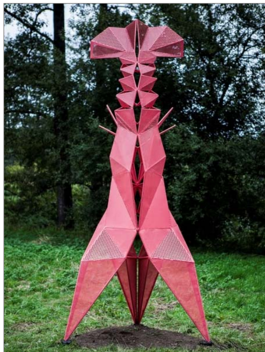
Obr. 1.3.1 Naučná stezka „Voda je věda“. Socha raka (vlevo) a vyzy velké (vpravo).

S podporou projektu scienceZOOM byla v roce 2013 vybudována ve Vodňanech naučná stezka Fakulty rybářství a ochrany vod JU s názvem „Voda je věda“. Stezku tvoří pětice stylizovaných soch (např. tři a půl metru vysoký růžový rak či omega3kapr v podobě houpačky) doplněných informačními tabulemi, na kterých mohou zájemci získat informace o výzkumu raků, vyzy velké – největší jeseterovité ryby na světě, o biomonitoringu, čistotě vody a dalších tématech, kterými se pracovníci fakulty v rámci svých výzkumných aktivit zabývají. Stezka má i svoji elektronickou - virtuální verzi, kde zájemci naleznou více informací, fotek a videí o jednotlivých tématech. Přístup do ní je umožněn také prostřednictvím QR kódů umístěných na jednotlivých informačních tabulích. Slavnostní vernisáž stezky se uskutečnila 26. září 2013 při příležitosti otevření nových budov Fakulty rybářství a ochrany vod JU, které vznikly s podporou projektu CENAKVA (Jihočeské výzkumné centrum akvakultury a biodiverzity hydrocenóz; blíže kapitola 9.3).