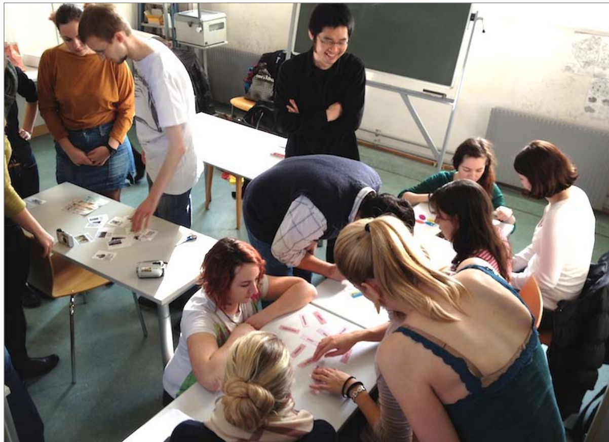
Obr. 10.3.1 Sommerkolleg 2013.

zpestřovala filmová produkce nebo autorská čtení zajímavých českých a rakouských spisovatelů. Víkendy byly již tradičně věnovány exkurzím a návštěvám historických památek po obou stranách hranice (např. Český Krumlov, Jindřichův Hradec nebo Freistadt). Katedra společenských věd Pedagogické fakulty JU spolupořádala na počátku září 2013 „Letní školu migrace a integrace“ zaměřenou na integraci imigrantů, jejich participaci a podporu různorodosti ve společnosti. Tato letní škola byla určena pro české studenty, mladé české zaměstnance nestátních neziskových organizací, státní správy, samosprávy a omezenému počtu zahraničních studentů.