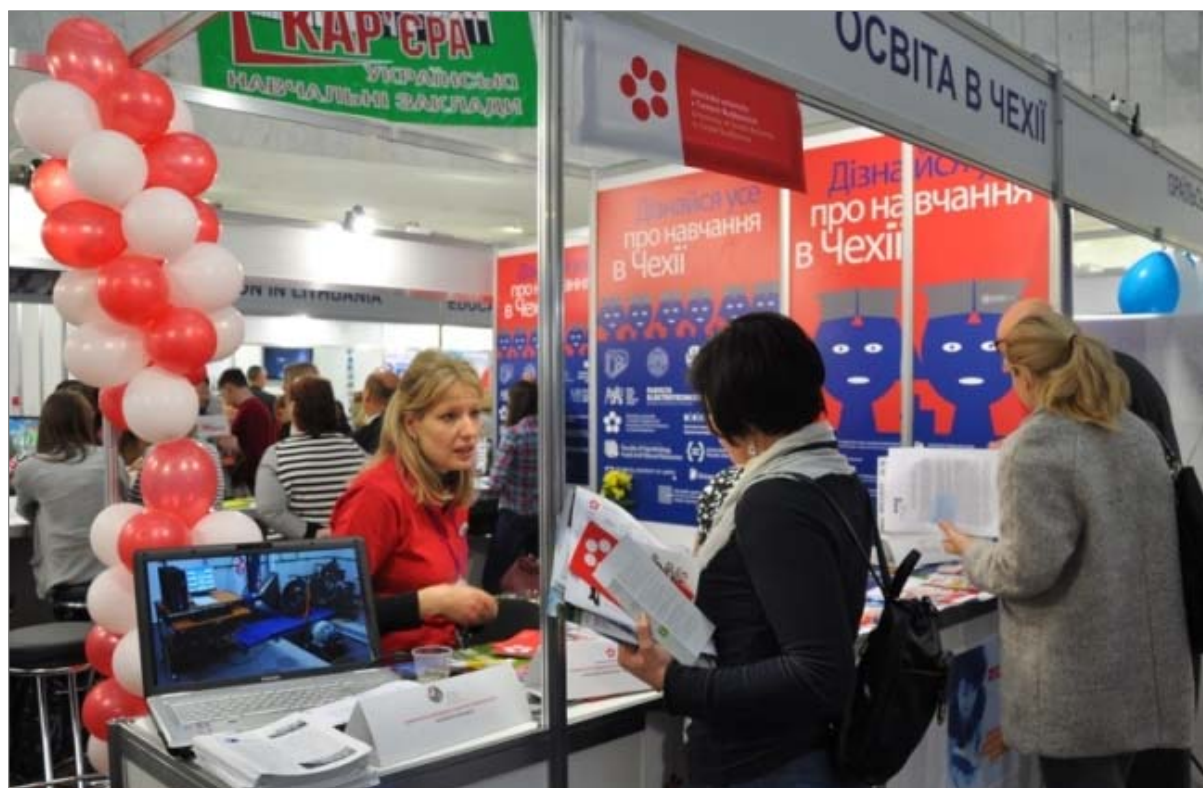
Obr. 12.1.1 Stánek Jihočeské univerzity na kyjevském veletrhu „Vzdělávání v zahraničí“.

S cílem zvýšit zájem studentů Jihočeské univerzity o zahraniční studijní pobyty a pracovní stáže a zároveň podpořit tvorbu mezinárodního prostředí na Jihočeské univerzitě jsou pravidelně organizovány semináře pro zájemce o práci či studium v zahraničí, dále jsou podporovány aktivity Mezinárodního studentského klubu JU, který funguje jako kontaktní místo pro zahraniční studenty pobývající na Jihočeské univerzitě, a aktivity českobudějovické pobočky studentské organizace AIESEC. Mezinárodní studentský klub JU v roce 2013 rozšířil nabídku svých dosavadních aktivit (mentorský program, studentské uvítací párty, vánoční setkání, organizace poznávacích výletů a exkurzí, soutěže, sportovní aktivity, atd.) o pravidelný cyklus cestovatelských přednášek s názvem „Studentské putování“, v rámci kterého jsou představována zajímavá a často exotická místa, na kterých působili či stále působí studenti Jihočeské univerzity. Podobná neformální vyprávění, na kterých se účastníci dozvědí nejen podrobnosti o studiu a praxi v zahraničí, ale také zajímavosti o vzdálených lokalitách, jsou uskutečňována např. také v rámci projektu scienceZOOM (blíže kapitola 1.3). Pro všechny zájemce o studium či pracovní stáž v zahraničí uspořádala Jihočeská univerzita v říjnu 2013 také první ročník akce s názvem „International Week“ (blíže o této akci kapitola 1.5.3).