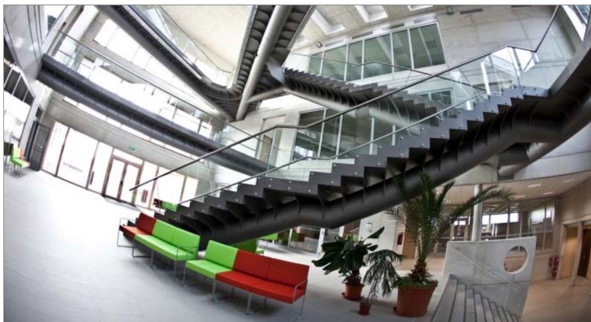
Obr. 9.3.2 Vstupní hala nového objektu „C“ Přírodovědecké fakulty JU.

Úspěšně pokračovala v roce 2013 také realizace infrastrukturního projektu v rámci OP VaVpl s názvem „Rozvoj PŘF JU“. Základním předmětem projektu je realizace investiční akce zaměřené na vytvoření infrastrukturních podmínek především pro rozvoj přírodovědných a technických oborů Přírodovědecké fakulty JU . Stěžejní součástí investiční akce byla realizace novostavby v areálu univerzity ve Čtyřech Dvorech při ulici Branišovská, která byla dokončena v září 2013. Součástí projektu jsou i dodávky přístrojového a dalšího vybavení, které budou pokračovat i v roce 2014. Plný provoz nového čtyřpodlažního objektu Přírodovědecké fakulty JU byl zahájen s počátkem letního semestru v únoru 2014.