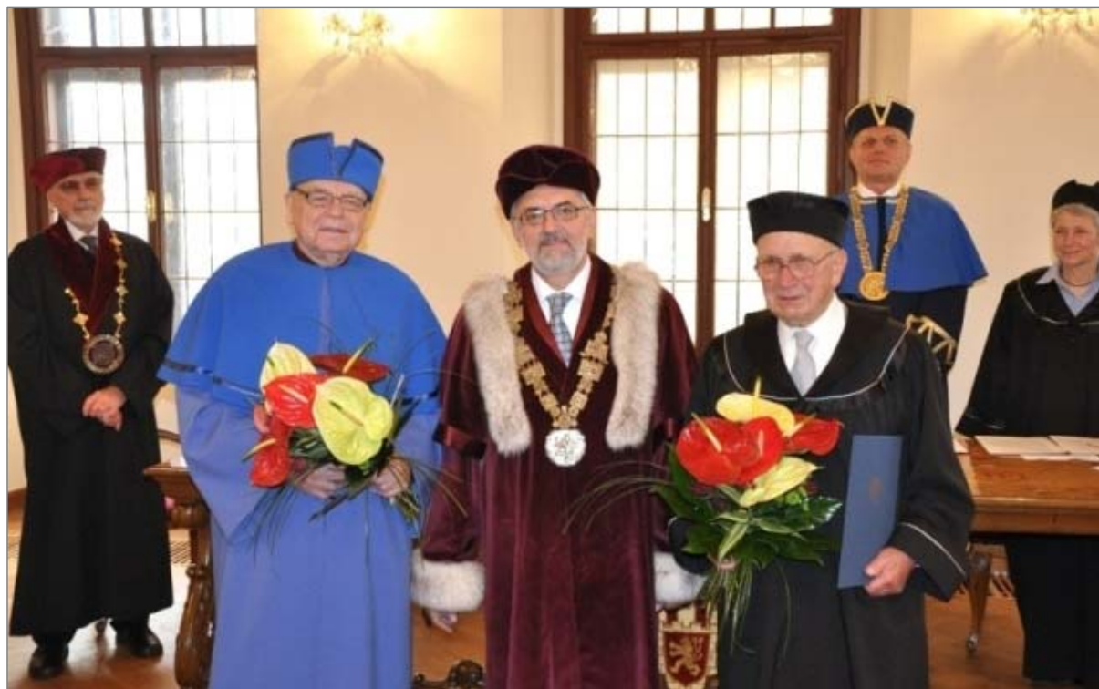
Tab. 7.5.3 Osobnosti oceněné Jihočeskou univerzitou v roce 2013 čestnou vědeckou hodností dr.h.c.