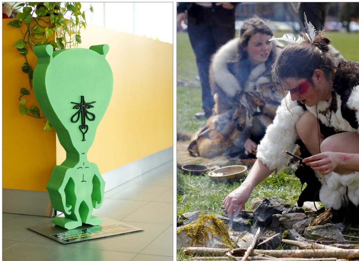
Tab. 1.5.3.1 Další aktivity roku 2013 (řazeno podle data zahájení akce, pokračování II)