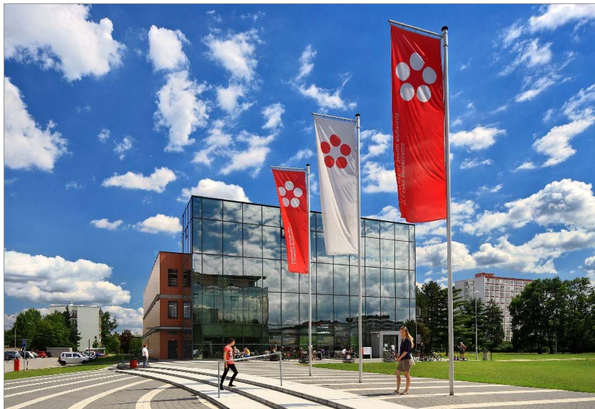
Obr. 1.1.1 Nový jednotný vizuální styl JU.