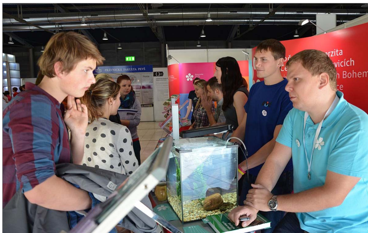
Obr. 6.4.1 Stánek Jihočeské univerzity na veletrhu Gaudeamus.